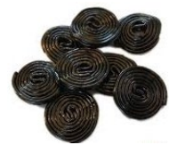
Lacets de réglisse 1 paquet