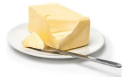
Beurre 1 noix