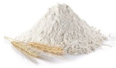
Farine 500 g