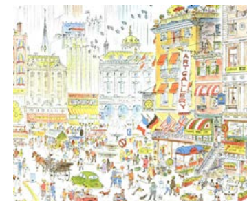
Illustrations : Cinq milliards de visages, 1981, Paris, L'école des loisirs.