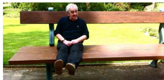
L'illustrateur et auteur pour enfant a fait grandir les bancs du Jardin des plantes à Nantes.