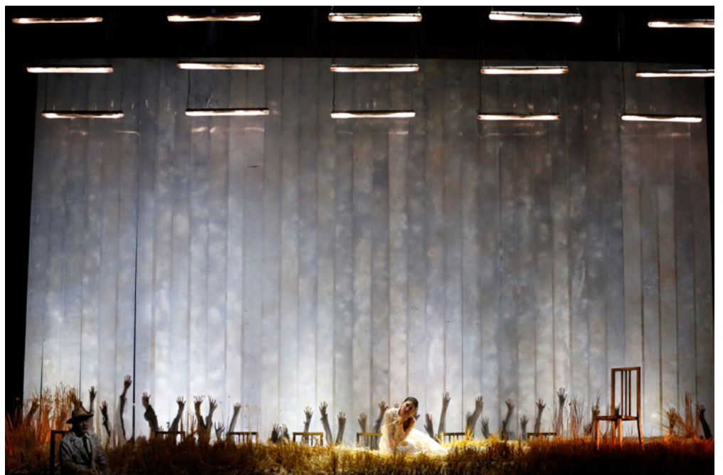
Alzira, à l'Opéra de Lima en novembre 2018 © DR.