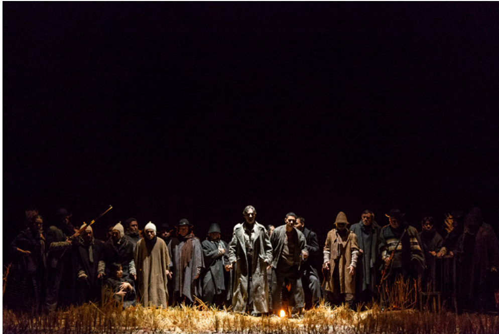
Alzira, à l'Opéra de Lima en novembre 2018 © DR.