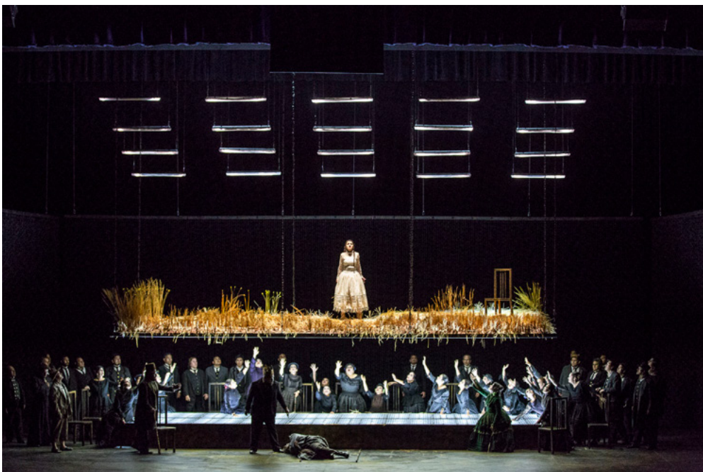
Alzira , à l'Opéra de Lima en novembre 2018 © DR.

Opéra très rarement joué, Alzira est l'œuvre la plus courte de Verdi. Son sujet exotique est directement inspiré d'une tragédie du même nom, écrite par Voltaire. Verdi est en mauvaise santé lorsqu'il compose cet opéra : il travaille trop et est épuisé ce qui retarde plusieurs fois la finalisation de l'œuvre ainsi que la première qui finit par avoir lieu à Naples en août 1845.