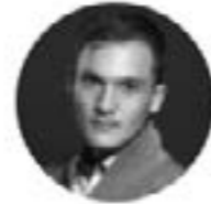
BARYTON LEON KOŠAVIĆ