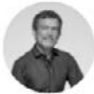
DIRECTION MUSICALE CHRISTOPHE ROUSSET