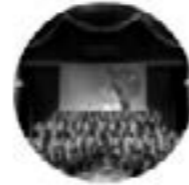
ORCHESTRE OPÉRA ROYAL DE WALLONIE-LIÈGE