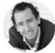
TÉNOR CYRILLE DUBOIS