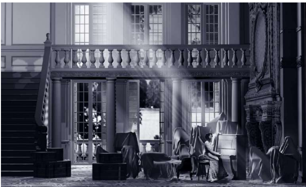
MAQUETTES DÉCORS DE DANIEL BIANCO

Plus tard, Lucio, un officier, vient annoncer à Otello que Rodrigo, que l'on pensait mort, est bien vivant, tandis que Iago, lui, s'est donné la mort après avoir révélé ses perfides tromperies. Arrivent entre-temps le Doge, Elmiro et Rodrigo, venus pour apaiser les tensions. Elmiro s'est ravisé et a décidé d'accorder la main de sa fille à l'étranger. Otello désespéré, horrifié par l'aveuglement dont il a fait preuve, révèle son geste. Desdemona a-t-elle survécu ?