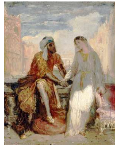
OTHELLO ET DESDEMONA, PEINTURE DE THÉODORE CHASSÉRIAU.

Dans cette vision adoucie de l'œuvre de Shakespeare, la jalousie et la perfidie restent néanmoins très présentes et sont portées par une musique d'une grande force et d'une profonde éloquence. À l'époque de sa création, en 1816, Otello reçoit d'ailleurs un accueil enthousiaste pour sa puissance et l'émotion que procure le tourment amoureux des protagonistes. L'œuvre connaît un certain succès jusqu'en 1887, date à laquelle l' Otello de Verdi l'éclipse.