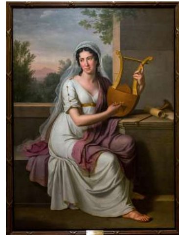
PORTRAIT D'ISABELLA COLBRAN, PAR HEINRICH SCHMIDT