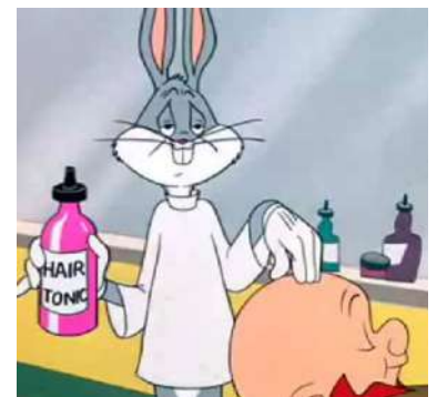
LA MUSIQUE DE ROSSINI ILLUSTRE UN ÉPISODE DE BUGS BUNNY APPELÉ LE LAPIN DE SÉVILLE (WARNER BROS, 1950).