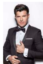
VINCENT NICLO OFFICIEL